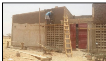
élévation des murs