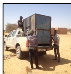
transport des citernes