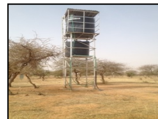
le château d'eau