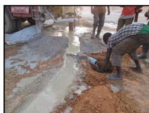
arrivée de l'eau